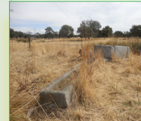
Pozo con brocal y pilas de granito