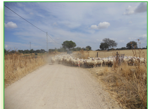
Rebano de ovejas en el camino tradicional